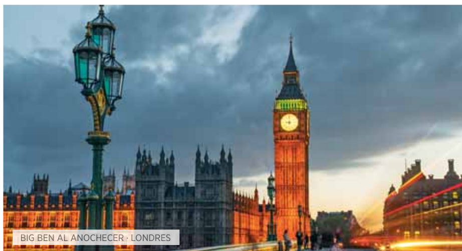
BIG BEN AL ANOCHECER · LONDRES