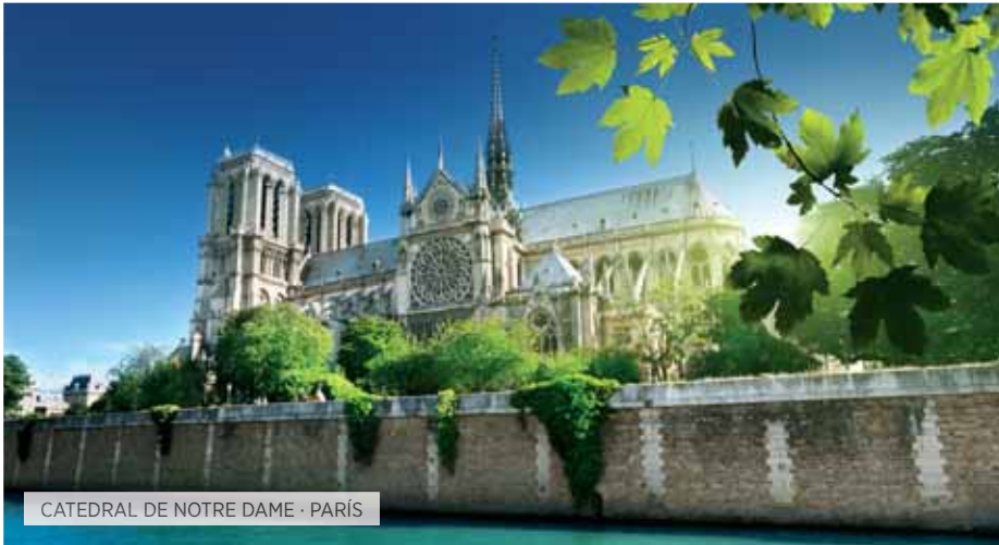
CATEDRAL DE NOTRE DAME - PARÍS