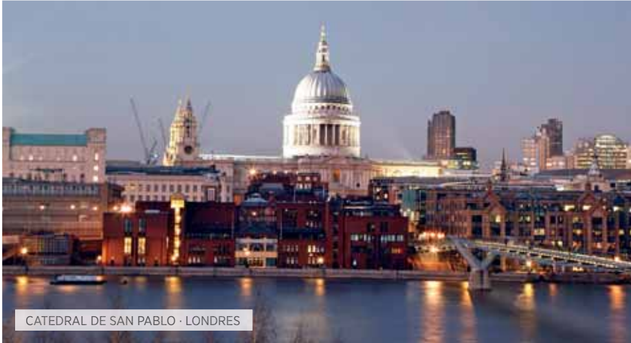
CATEDRAL DE SAN PABLO · LONDRES