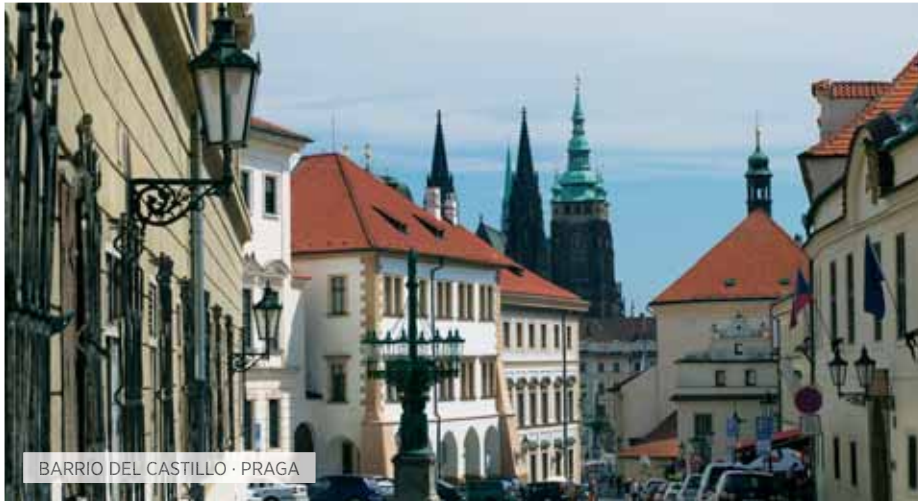
BARRIO DEL CASTILLO · PRAGA

V. Inter-europeo Includido T Special Tentación S Special Selección