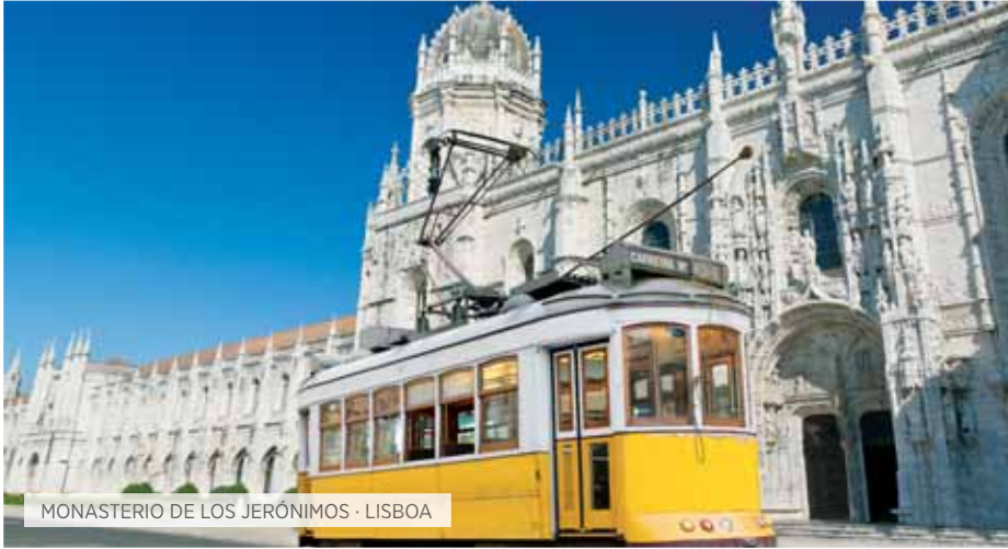
MONASTERIO DE LOS JERÓNIMOS · LISBOA

V. Inter-europeo Incluido T Special Tentación S Special Selección