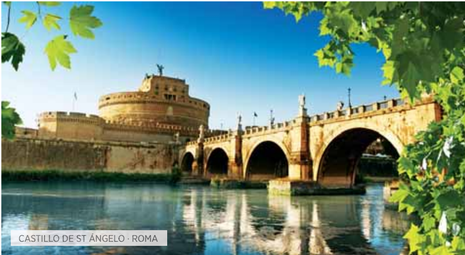
CASTILLO DE ST ÁNGELO · ROMA