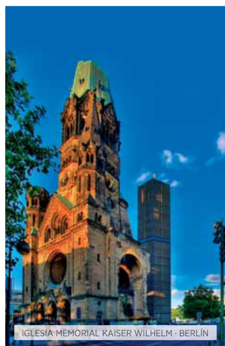
IGLESIA MEMORIAL KAISER WILHELM · BERLÍN

Desayuno. Visita panorámica de lo más característico de la capital de Alemania: veremos la Iglesia Conmemorativa del Kaiser Guillermo, la Isla de los Museos, la famosa avenida Kudamm, Alexander Platz, el barrio de San Nicolás, la plaza de la Gendarmería, los restos del Muro, la avenida de Unter