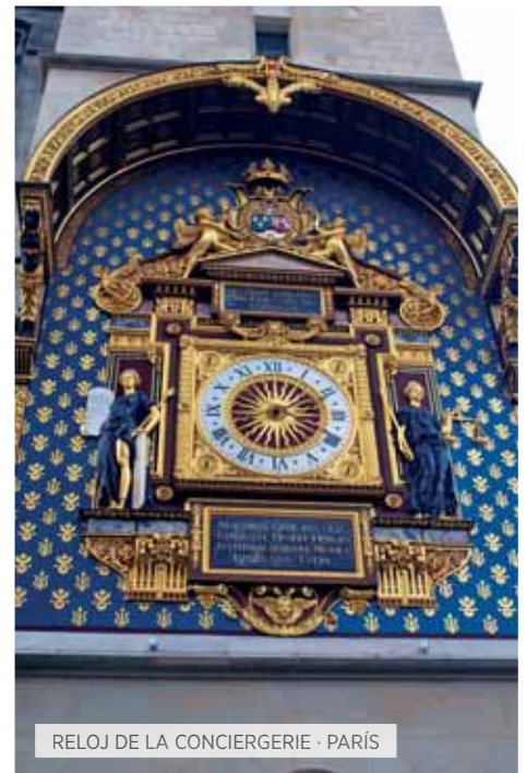
RELOJ DE LA CONCIERGERIE · PARÍS

Desayuno. Visita panorámica: El Monasterio de los Jerónimos, la Torre de Belem, el Monumento a los Descubridores, Alfama las Plazas del Comercio, del Rossio y