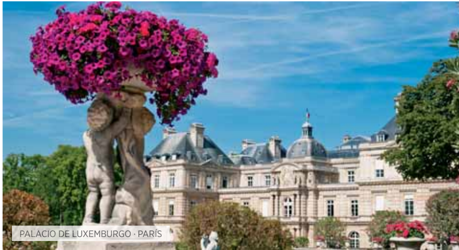
PALACIO DE LUXEMBURGO · PARÍS

V. Inter-europeo Incluido T Special Tentación S Special Selección