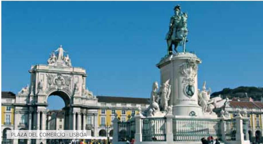
PLAZA DEL COMERCIO · LISBOA