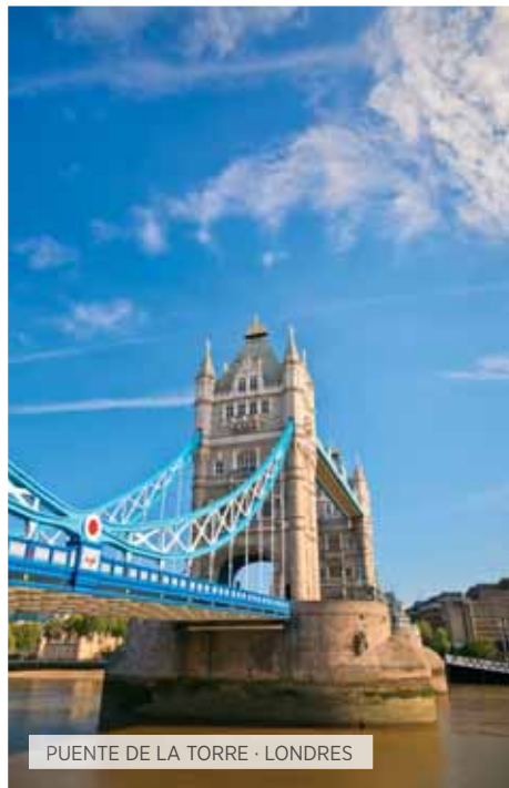
PUENTE DE LA TORRE · LONDRES

Tiempo libre hasta la hora de traslado al aeropuerto para tomar el vuelo a Lisboa. Llegada y traslado al hotel. Resto del día libre para un primer contacto con la bella capital lisboeta, y disfrutar de su gente, sus plazas y rincones. Cena y alojamiento.