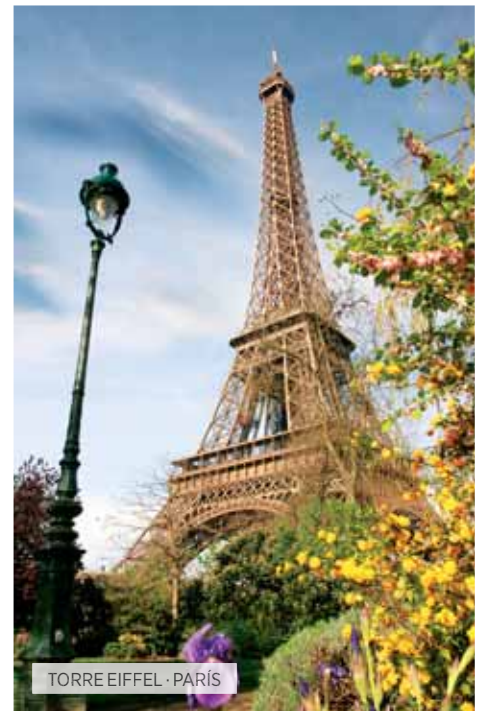
TORRE EIFFEL · PARÍS

Desayuno. Tiempo libre hasta la hora de traslado al aeropuerto para tomar el vuelo hacia Roma. Llegada y traslado al hotel. Si lo desea podrá realizar una visita opcional de la Roma Barroca, en la que recorreremos algunos de los lugares más característicos de esta milenaria ciudad, conociendo sus plazas más emblemáticas y sus fuentes más re-