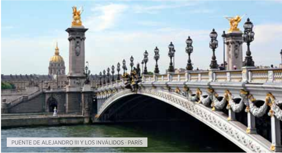
PUENTE DE ALEJANDRO III Y LOS INVÁLIDOS · PARÍS