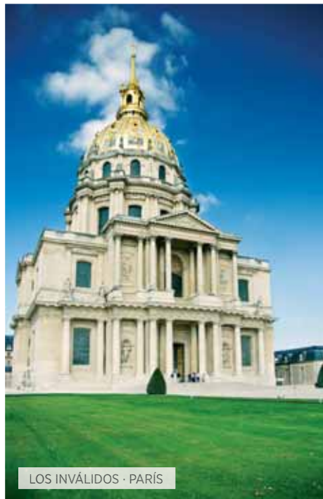
LOS INVÁLIDOS · PARÍS

Desayuno. Visita panorámica de lo más característico de la capital de Alemania: veremos la Iglesia Conmemorativa del Kaiser Guillermo, la Isla de los Museos, la famosa avenida Kudamm, Alexander Platz, el barrio de San Nicolás, la plaza de la Gendarmería, los restos del Muro, la avenida de Unter