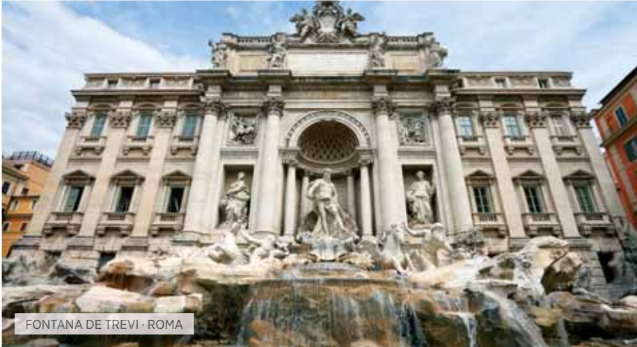
FONTANA DE TREVI · ROMA