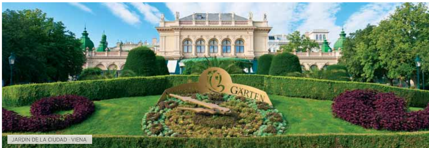
JARDIN DE LA CIUDAD · VIENA