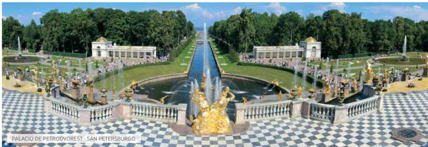
PALACIO DE PETRODVOREST · SAN PETERSBURGO