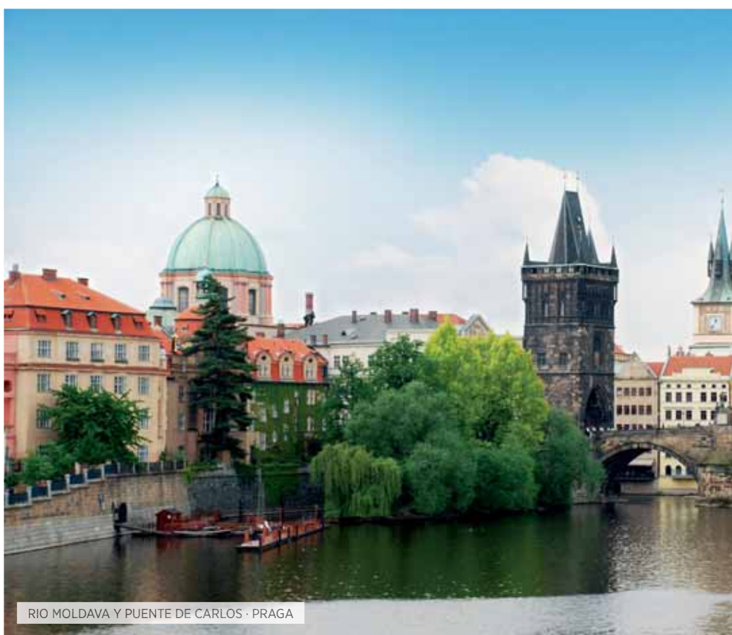
RIO MOLDAVA Y PUENTE DE CARLOS · PRAGA

Desayuno y día libre. Posibilidad de realizar una visita ( Opción TI ) al Kremlin, antigua residencia de los zares, con las catedrales de la Anunciación y de la Asunción, en ella se coronaban los zares y la de San Miguel Arcángel, en la cual están enterrados numerosos zares. ( Cena Opción TI ). Al final del día, traslado a la estación de ferrocarril para tomar un