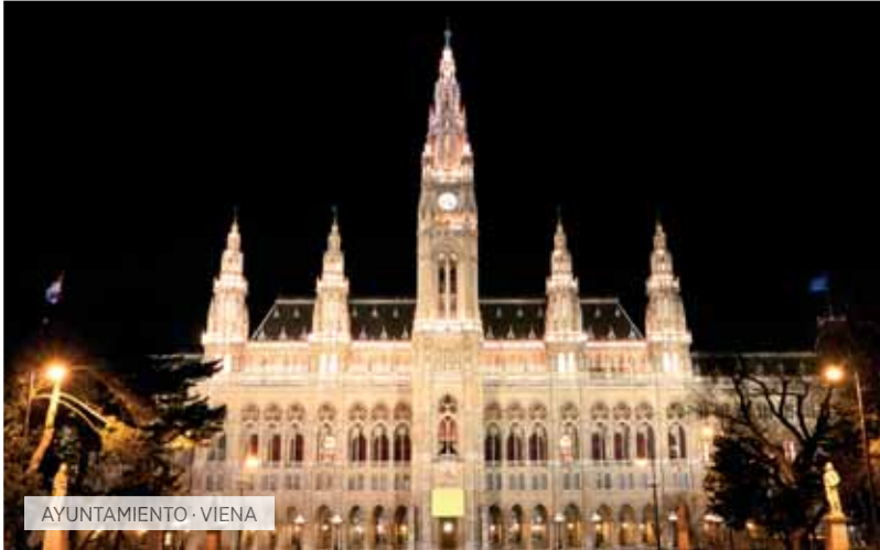
AYUNTAMIENTO · VIENA