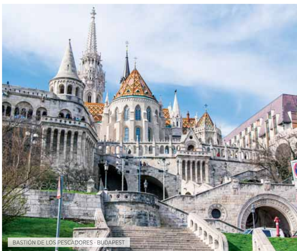
BASTIÓN DE LOS PESCADORES · BUDAPEST

Desayuno. Día libre o si lo desea podrá realizar una visita opcional de "Budapest Histórica", admirando el interior de la Gran Sinagoga, uno de los edificios más emblemáticos de la ciudad, ya que se encuentra en el lugar donde establecieron los nazis el gueto judío. Construida con influencias moriscas, se considera la más grande de Europa y la segunda del Mundo. Durante esta visita también conoceremos la Ópera, en estilo neo renacentista y financiada por el emperador Francisco José es considerada como una de las óperas más elegantes del mundo. Si lo desea podrá realizar opcionalmente una excursión en la que se combinará un