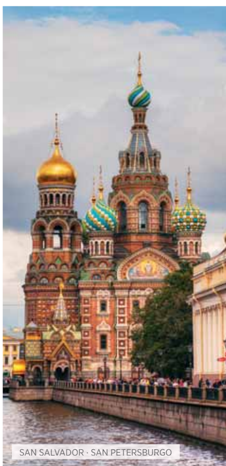
SAN SALVADOR · SAN PETERSBURGO

Desayuno. Visita panorámica de la ciudad, conoceremos entre otros lugares la monumental Ringstrasse, avenida de más de 5 kilómetros de longitud donde se encuentran