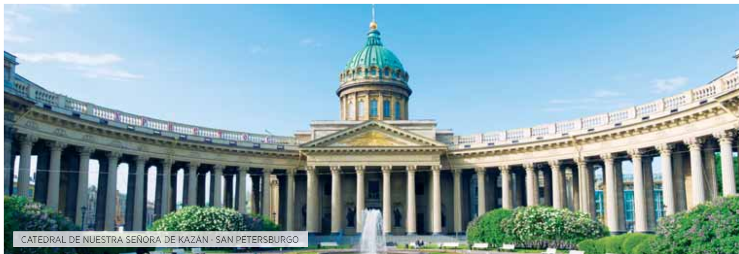
CATEDRAL DE NUESTRA SEÑORA DE KAZÁN · SAN PETERSBURGO