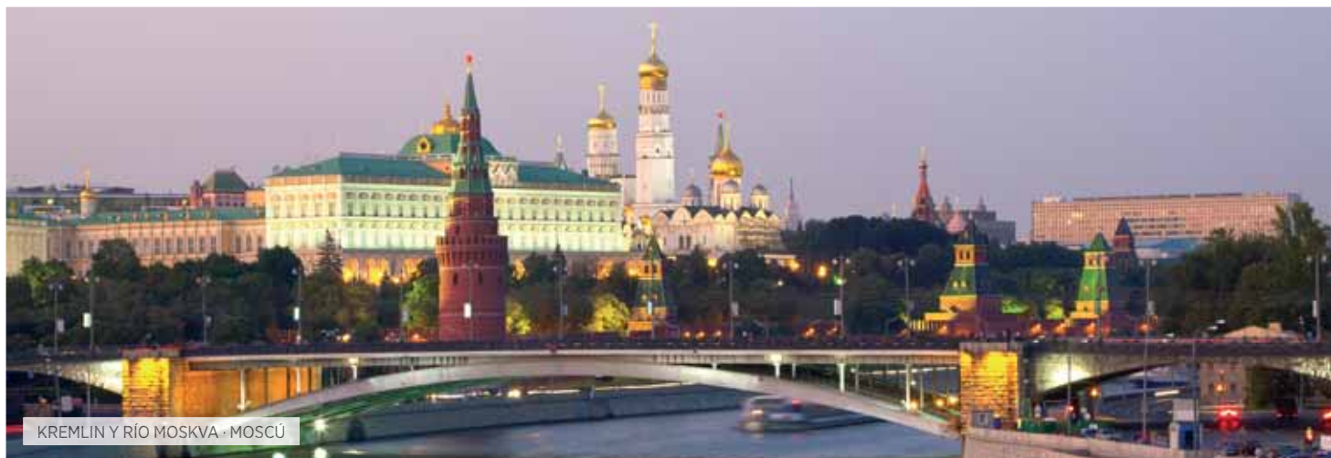
KREMLIN Y RÍO MOSKVA · MOSCÚ