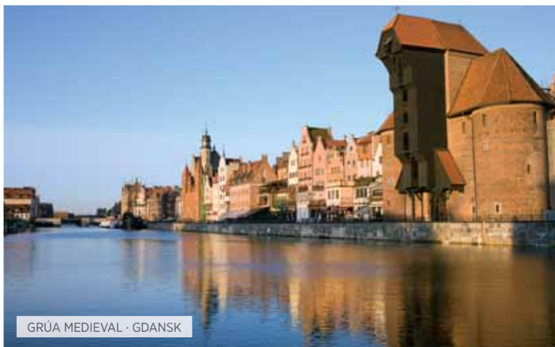
GRÚA MEDIEVAL · GDANSK