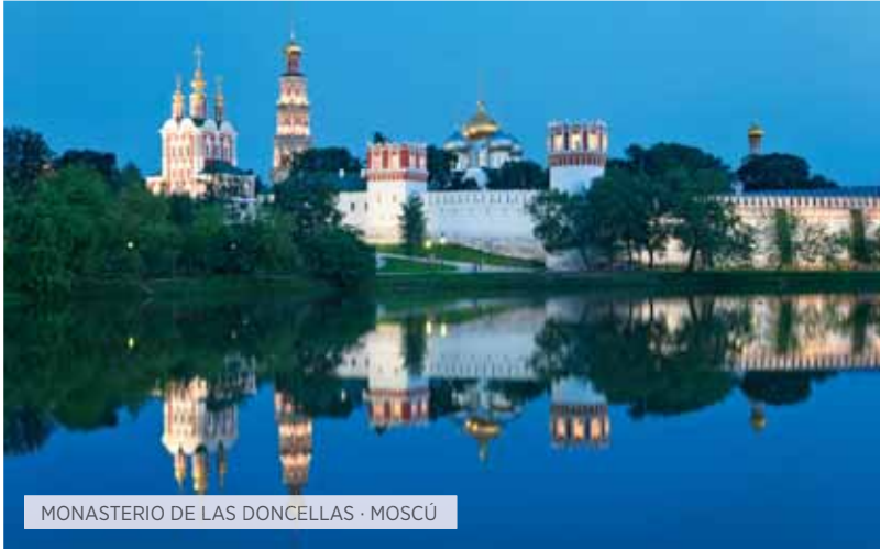
MONASTERIO DE LAS DONCELLAS · MOSCÚ