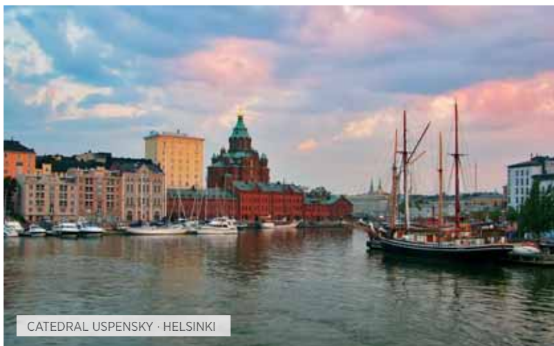
CATEDRAL USPENSKY · HELSINKI