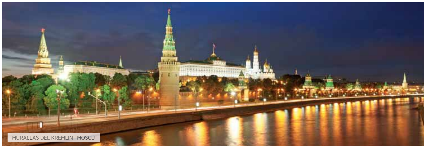
MURALLAS DEL KREMLIN · MOSCÚ