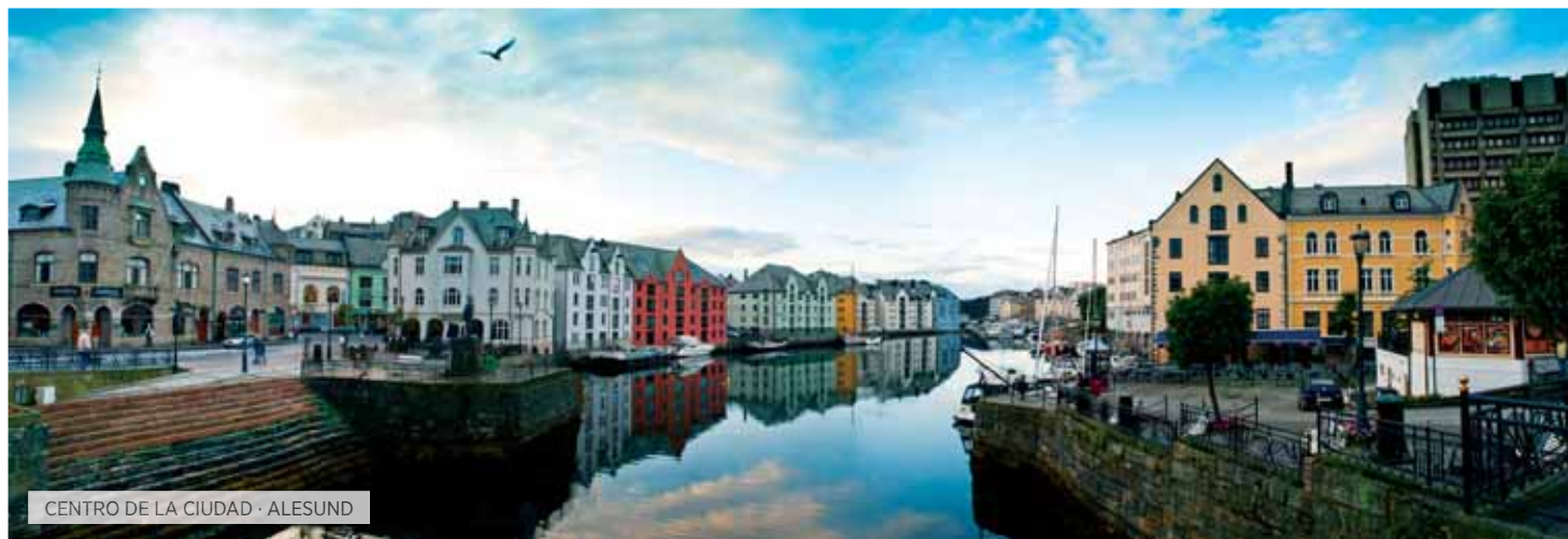
CENTRO DE LA CIUDAD · ALESUND