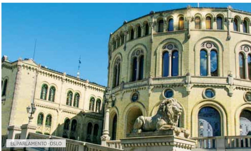
EL PARLAMENTO · OSLO

Desayuno. Visita panorámica en la que realizaremos un recorrido en autobús por los puntos más importantes de la ciudad y daremos un paseo a pie por la Gamla Stan o Ciudad Vieja, cuatro islas unidas entre sí sobre las que Biggerl Jarl fundó la ciudad hace 700 años, en nuestro recorrido conoceremos la Gran Plaza, la Catedral, el Palacio Real, la Isla de los Nobles, etc. Si lo desea podrá realizar una visita opcional del Museo Vasa, galeón real hundido durante su botadura, recuperado 333 años después, hoy restaurado en todo su esplendor y también visitaremos el interior del Ayuntamiento, donde conoceremos entre otras estancias, el Salón Azul donde cada año, el 10 de Diciembre, se cele-