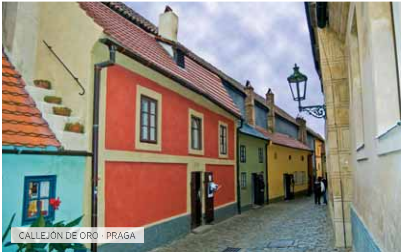
CALLEJÓN DE ORO · PRAGA