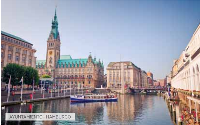
AYUNTAMIENTO · HAMBURGO