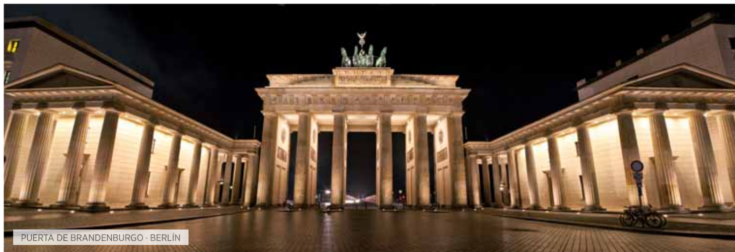
PUERTA DE BRANDENBURGO · BERLÍN