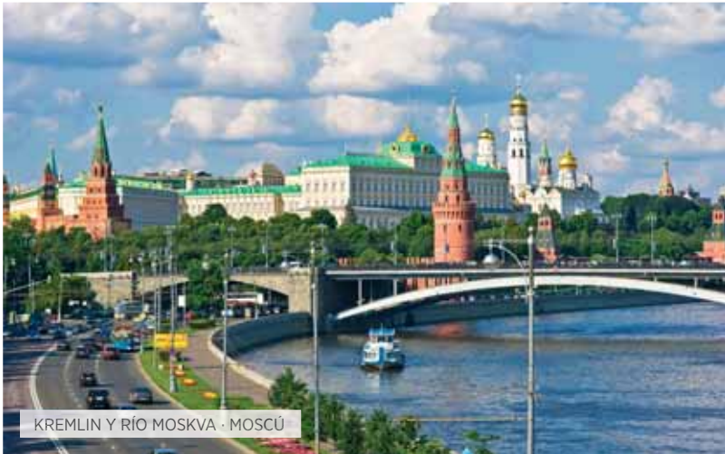
KREMLIN Y RÍO MOSKVA - MOSCÚ