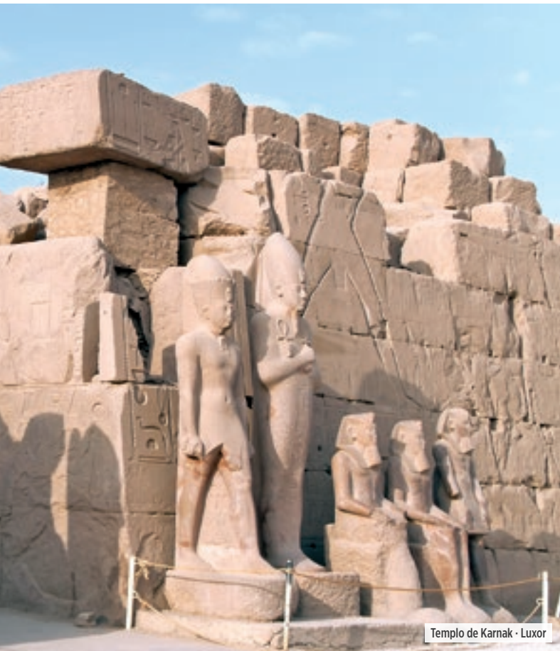
Templo de Karnak - Luxor

Desayuno. Tiempo libre hasta la hora del traslado al aeropuerto de El Cairo, para embarcar en su vuelo y Fin de nuestros servicios.