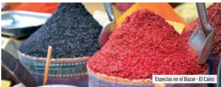
Espicias en el Bazar - El Cairo

Niños hasta 10 años: 40% descuento en Triple.